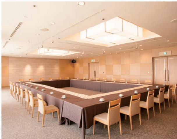
エクセレントルーム